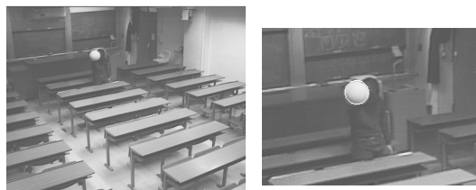
図 1: 画像処理結果

大きさ（半径）が既知で、背景にあまり出てこない色のボールを用いる。ボールが投影された画像上の円の中心はほぼボールの中心の投影点になっているので、これを対応付けされた特徴点の投影座標として用いる。ボールの大きさはカメラ間の平行移動のスケールを決定するために必要となるのであらかじめ測定しておく。また、ボールが投影された画像からの円の中心と半径の獲得には、背景差分やハフ変換による円当てはめを行うことで獲得する。実際に円当てはめを行った結果を図1に示す。