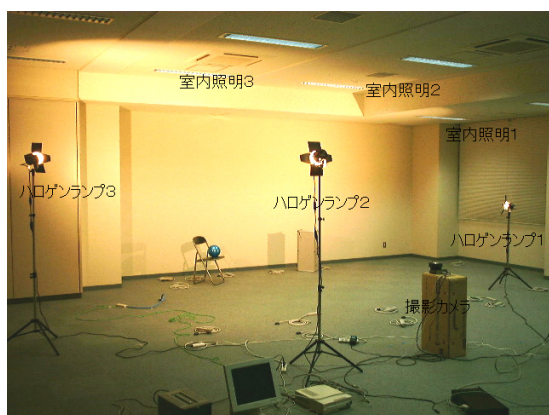
図 1: 実験環境

実験には、撮影カメラとして SONY 製 EVI-D30 を固定して設置し、照明は、調光機 (T5 製 Effect Arts) によって 128 段階の光量調節が可能、つまり v = 0 \dots 127 であるハロゲンランプ (LPL 製 500W) 3 台及び、全点灯、全消灯のみができる、つまり v = 0, 1 である室内の照明 3 系統 (1 系統あたり 32W の蛍光灯 12 本) を使用した。実験は夜間、ブラインドを閉じて行い、太陽などの未知光源の影響を受けないようにした。