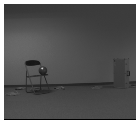
(a) 合成された背景画像

背景の合成画像 (図 2(a)) と、前景が加わった実際の画像 (図 2(b)) との差分から、前景の画像領域を抽出し、ノイズ除去をした。その結果、図 2(c) のように前景の画像領域が抽出できた。